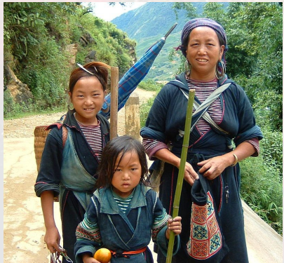
Hmong dans les environs de Sapa