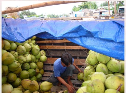
Marché flottant de Can Tho