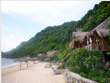
Bay d'Ha Long et ses innombrables îles