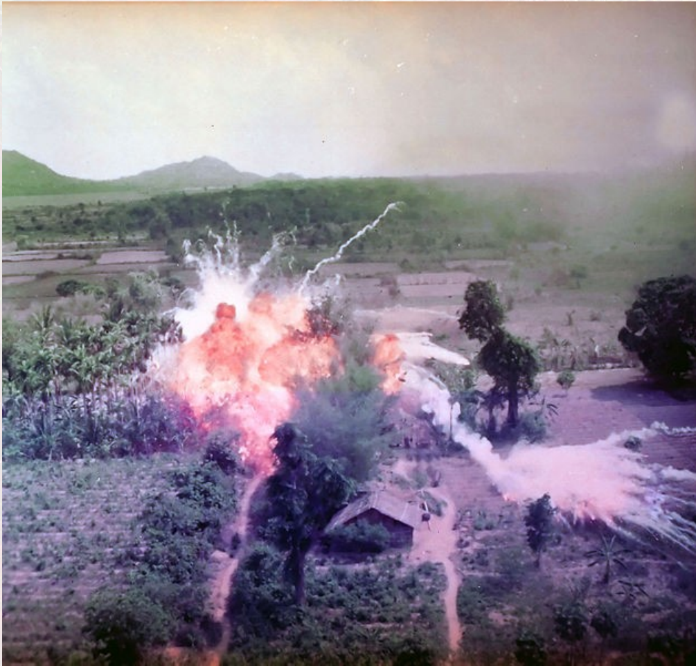
Napalm attaque et fuite d'enfants...