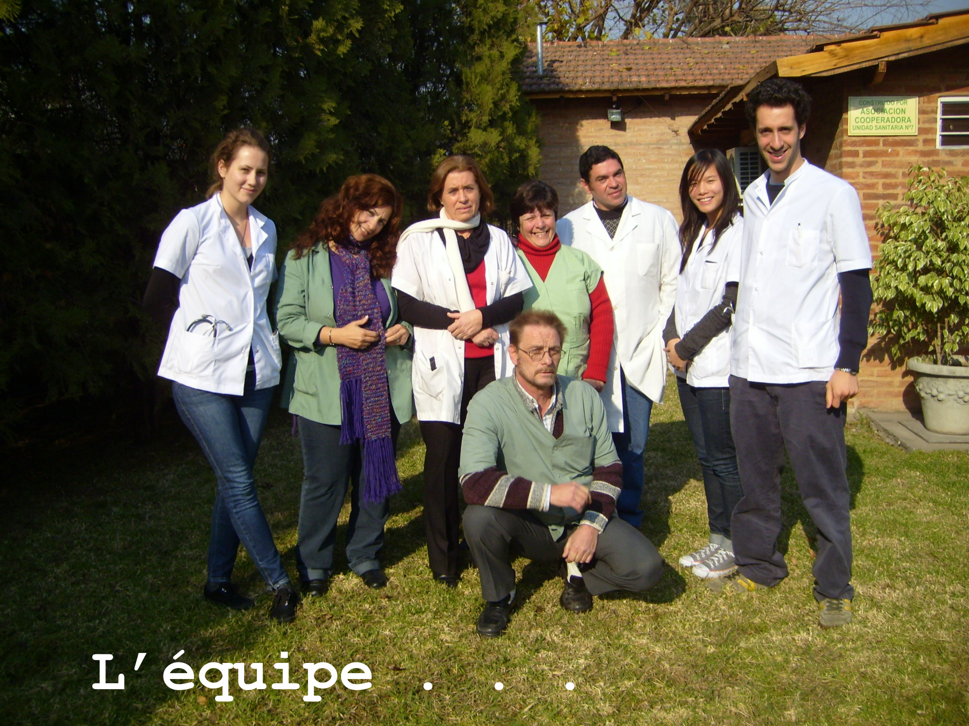
L' équipe . . .